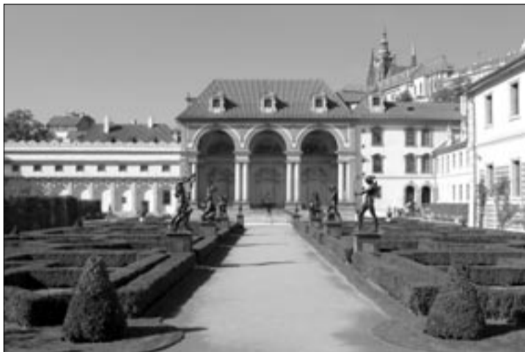
Sala terrena Valdštejnské zahrady Senátu PČR.